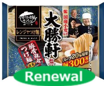
大勝軒監修 豚骨魚介つけ麺

株式会社キンレイ 商品一覧< https://www.kinrei.com/menu/ >