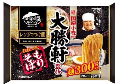
大勝軒監修 伝統の味 もりそば