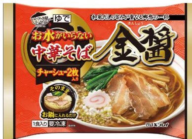
お水がいない 中華そば金醬(きんしょう)