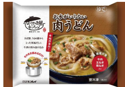
お水がいない 肉うどん