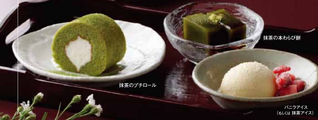
抹茶のプチロール